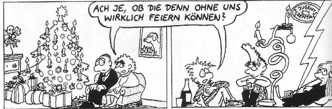
Den Freiheitsdrang der älteren Kinder will man dieses Jahr respektieren ...