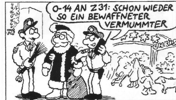
Aber ach, keiner ist vor Überraschungen sicher.