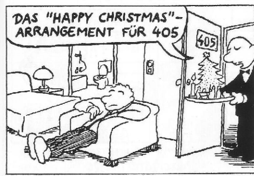
Falls man diesmal dem heimischen Weihnachtsbaum entfliehen will ...