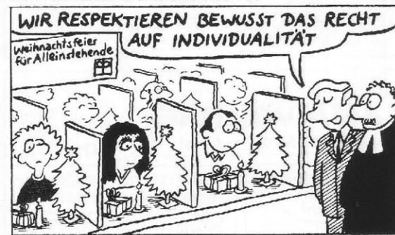
Auch die professionellen Weihnachtsveranstalter wollen aus Erfahrungen lernen ...