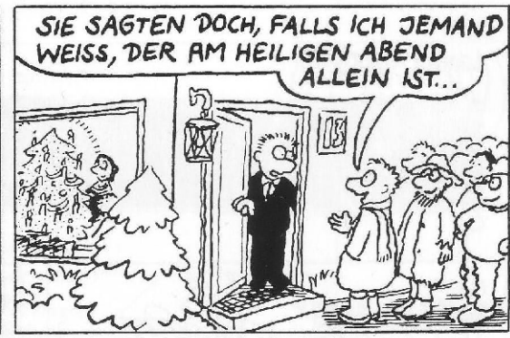
... und sogar einmal einen Fremden einladen.