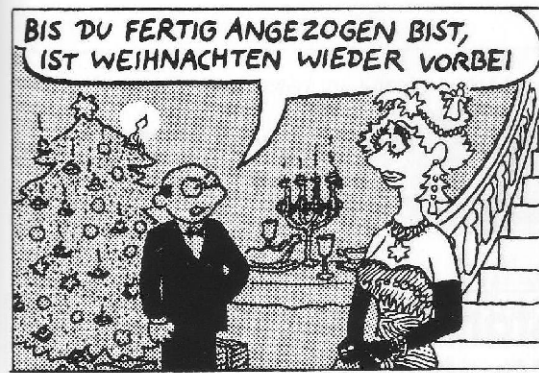
... den Zeitablauf des Festes perfekt planen ...