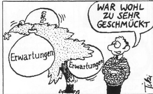
Jedoch: Es bleibt ja die Hoffnung auf das nächste Jahr.