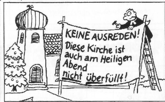
... und die Mißerfolge des vergangenen Jahres vermeiden.