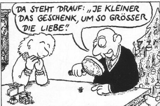
... keine großen Geschenke verteilen ...