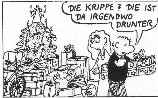
... sondern die frohe Botschaft in den Mittelpunkt stellen ...